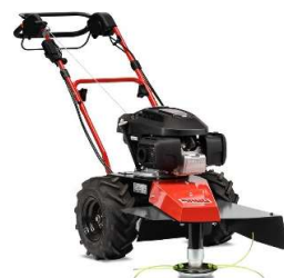
60-PRO T DRIVE