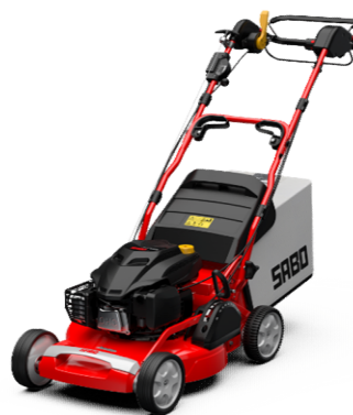
54-K VARIO B