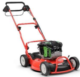
53-PRO E M VARIO