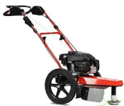
60-PRO T PUSH