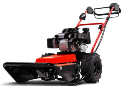
50-PRO C DRIVE