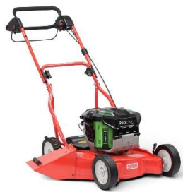
50-PRO E S VARIO