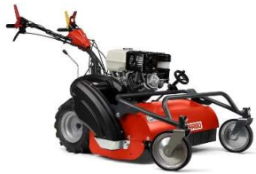
75-PRO F VARIO