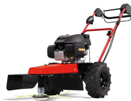
60-PRO T DRIVE