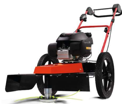
60-PRO T PUSH