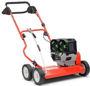
45-PRO E V PUSH