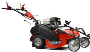
60-PRO F VARIO