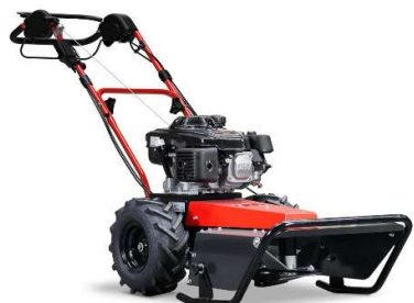
50-PRO C DRIVE