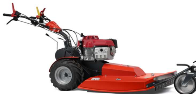
70-PRO C VARIO