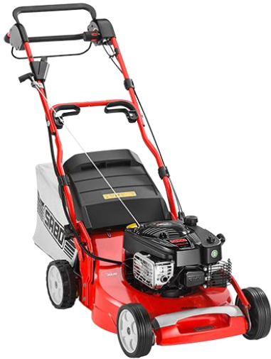
54-K VARIO E