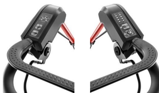
Bediening variabele snelheid + accu-info en start/stop