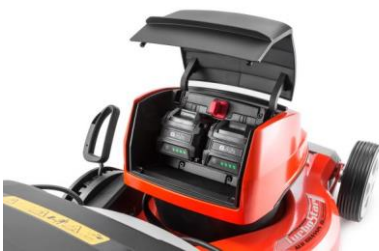
Batterijen bij 47-ACCU VARIO