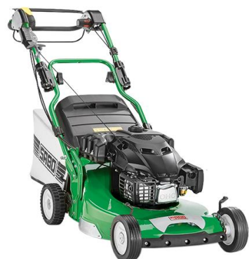
54-PRO K VARIO B PLUS