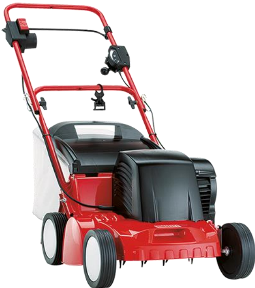
35-V EL, met opvangzak