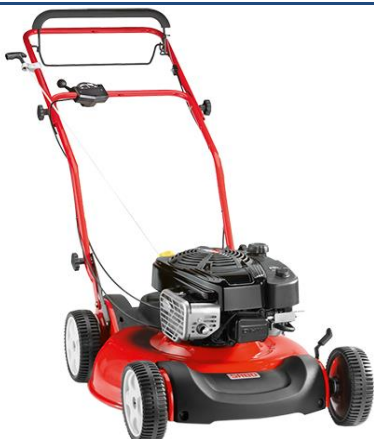
JS 63 VARIO